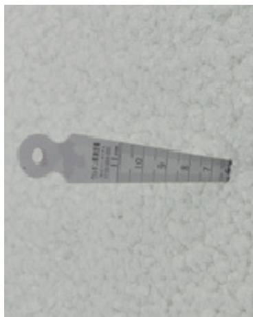
現場発泡硬質 ウレタンフォーム