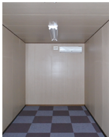
エアコンが 完備された室内