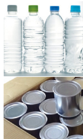
備蓄食や水 などを安全に保存